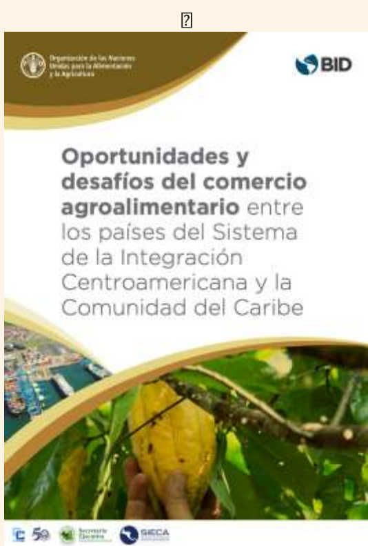
Oportunidades y desafíos del comercio agroalimentario entre los países del Sistema de la Integración Centroamericana y la Comunidad del Caribe

We invite you to review the main findings and recommendations of both reports below: