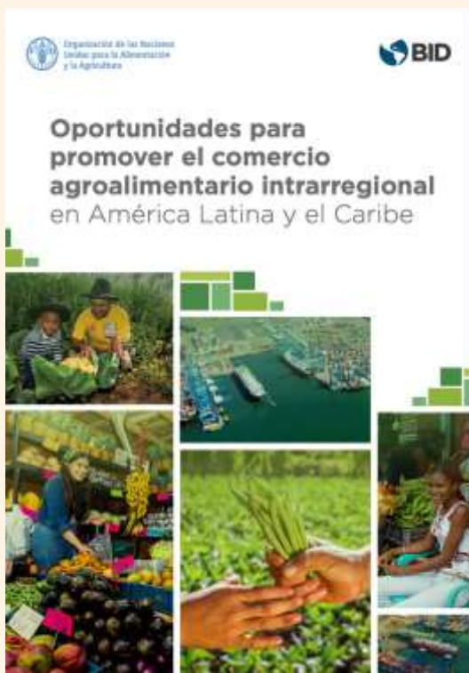
Oportunidades para promover el comercio agroalimentario intrarregional en América Latina y el Caribe