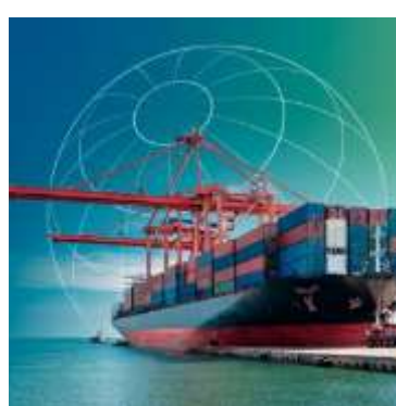
Agriculture in Regional Trade Agreements (RTAs)