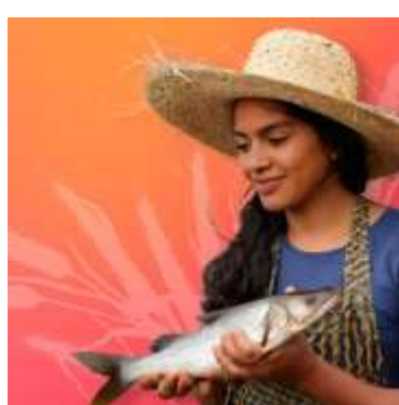
Introduction to Trade, Food Safety and Nutrition