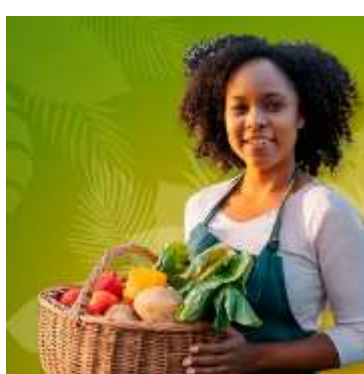
Governance of Trade, Food Security and Nutrition